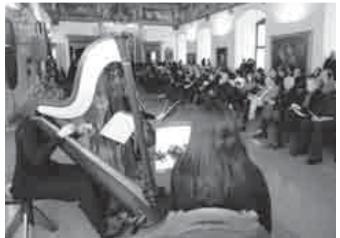
La sala nell'intervallo dei lavori.

Rivolto all'assessore dice: nuova legge istitutiva SSP (legge 16); alcuni nostri suggerimen-