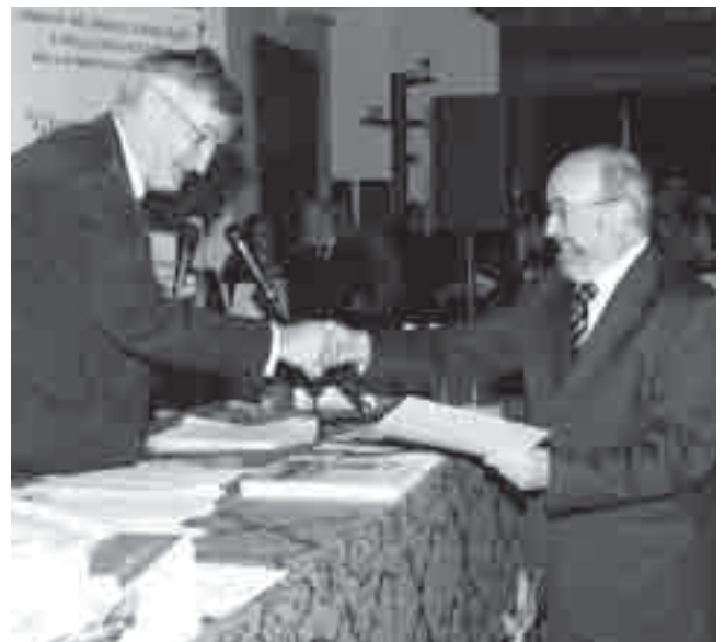
La consegna della pergamena ad un collega.

12:15 Dopo la presentazione del libro in onore del centenario dell'Ordine dei Medici in Italia si dichiara chiusa la seduta.