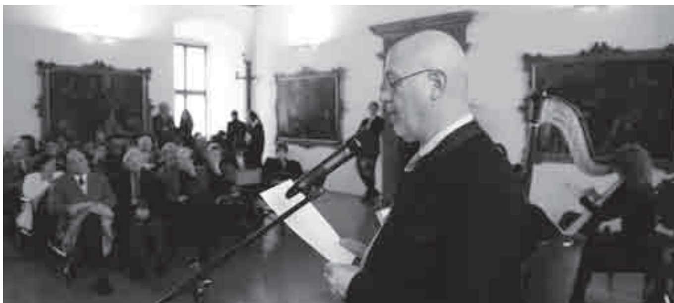
Il poeta declama poesie alla Giornata del Medico.

Nonostante l'entusiastica accoglienza ai nuovi colleghi il 20 novembre scorso ( La meglio gioventù.. ) i brividi sulla nostra pelle sono frequenti quando si legge – esterrefatti – di errori professionali classificati ormai come malasanità , non sappiamo se in buona o mala fede, da alcuni colleghi giornalisti. Quando succedono episodi che non dovrebbero succedere ed accadono lutti in famiglie che si rivolgono con tanta fiducia a medici operanti in strutture pubbliche si rimane esterrefatti. “I chirurghi sono dovuti uscire dalla sala operatoria perché si stavano addormentando per perdita di gas tossico” . Primari incapaci e negligenti, altri bravi ma senza strutture e personale di supporto.... Sventrava a cielo aperto, la porta d'accesso libera a chiunque e da cui si vedeva un chirurgo intento di bisturi su un paziente mentre parlava a mezza labbra per la sigaretta a bordo bocca “Nell'ospedale di..... – meno di due anni fa – un diabetico giunto perché si è infilzato un chiodo nel tallone: tre interventi chirurgici, gli ultimi due per subentrate infezioni: un mese di ricovero; entrato con i suoi i piedi rischia di uscire con i piedi in avanti...” I rampolli di razza “nobile” si candidano alle elezioni universitarie, raccogliendo molti più consensi di chi di razza nobile non è.. ”. Rammento uno che negli studi di medicina ha imparato solo l'anato-