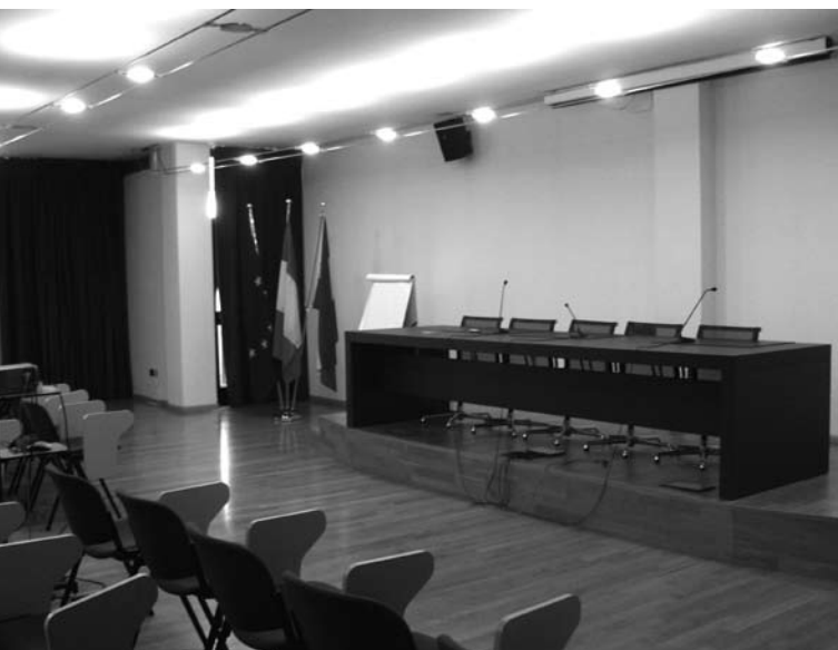
L'aula magna della nostra sede.

In futuro è prevedibile un risparmio energetico (spendiamo attualmente € 13.000 per gas