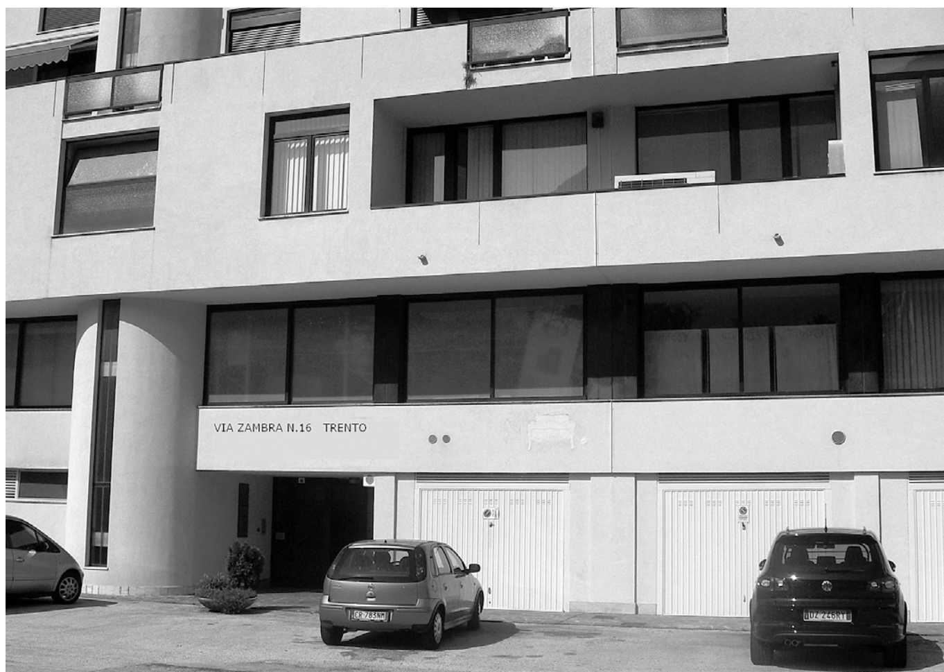
Ingresso central della sede dell'Ordine.

Dai rilievi emerge che oltre alla mancanza di agibilità, l'impianto di riscaldamento e raffre-